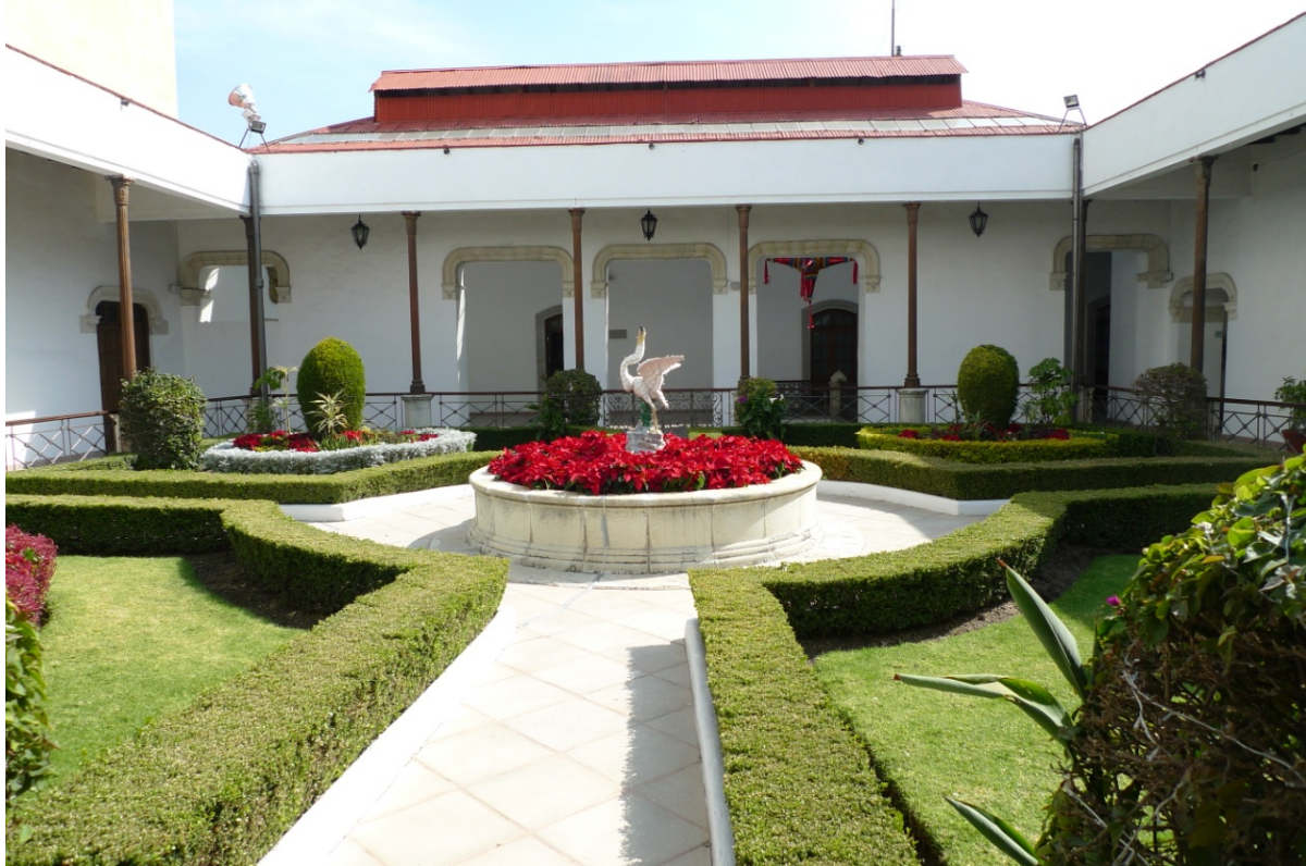
Фото 2. Внутрішній двір адміністративних споруд – в центрі скульптура морської чаплі – символу УАЕН

УАЕН поділено на шість факультетів в столиці Ідальго – місті Пачука, також мається декілька кампусів, які розміщені по всьому штату Ідальго: Актопан, Апан, Атотонілько-де Тула, Сьюадад-Сахагун, Хуеютла-де Рейес та інші, а також чотири підготовчі школи в Пачуці. Всі студенти навчаються за державний кошт.