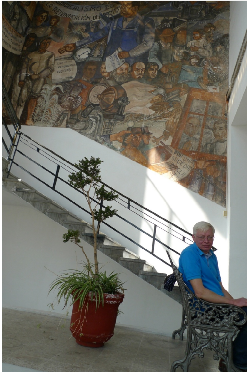
Фото 3. Внутрішні стіни адміністративного помешкання прикрашені муралами «лівого» змісту в стилі Сікейроса

Розписи внутрішніх стін Адміністративного корпусу максимально ідеологізовані, просочені пафосом боротьби проти соціального гніту та насильства, образи, які представлені на картинах мають підвищену експресію, значну пластику та активний вплив художніх творів на педагогічні та студентські маси. Представлені монументальні композиції, в яких конкретні персонажі переплітаються з символічним уособленнями соціально-історичних сил – використовуються ефекти динамічної перспективи, що скорочується.