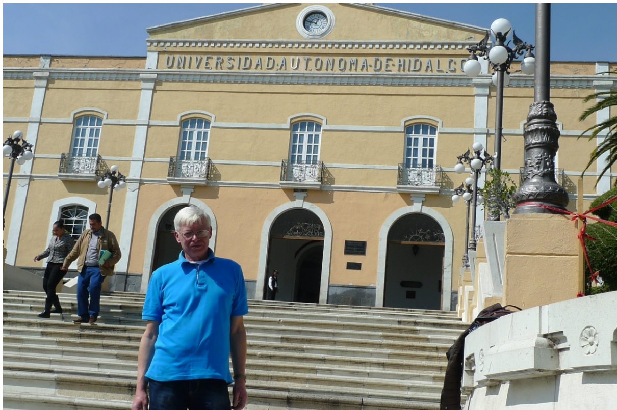
Фото 1. Адміністративний корпус UAEN в центрі міста Пачука, штат Ідальго

Під час мексиканської революції (1910-1917рр.) університет декілька разів закривався, але вистояв та в 1921 році став відомим, як Ідальгоський університет, але в 1925 році йому було повернено первісну назву.