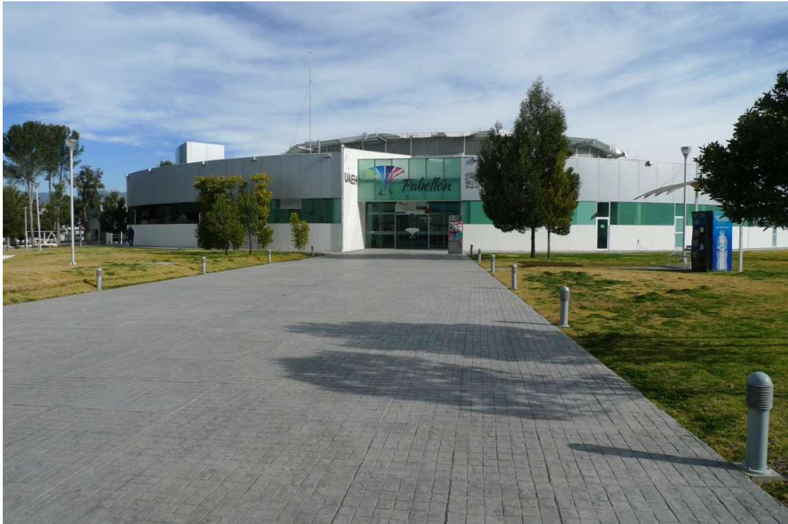
Фото 5 Pavellón – центр всього суспільного життя студентства та викладачів