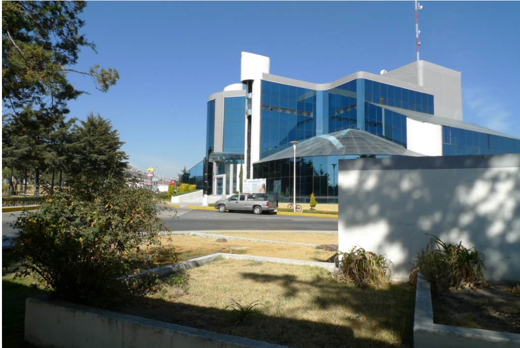
Фото 7. Один з фонетично-мовних центрів університету

Дуже велика увага приділяється «мовному питанню» – вивчення мов ведеться в двох мовних центрах обладнаних самим сучасним обладнанням з використанням прогресивних методик.(фото 7).