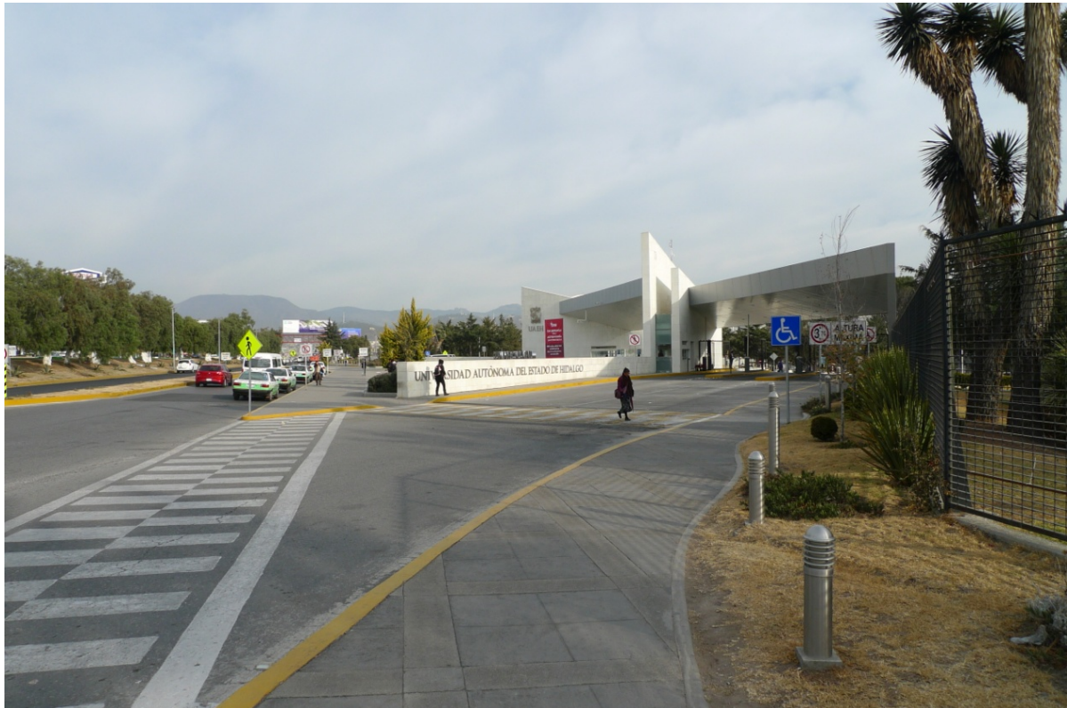
Фото 4. Центральний вхід до учбового містечка у м. Пачука

Учбовий процес поділено на два семестри причому перший починається з 8 січня, після різдвяних та новорічних свят.