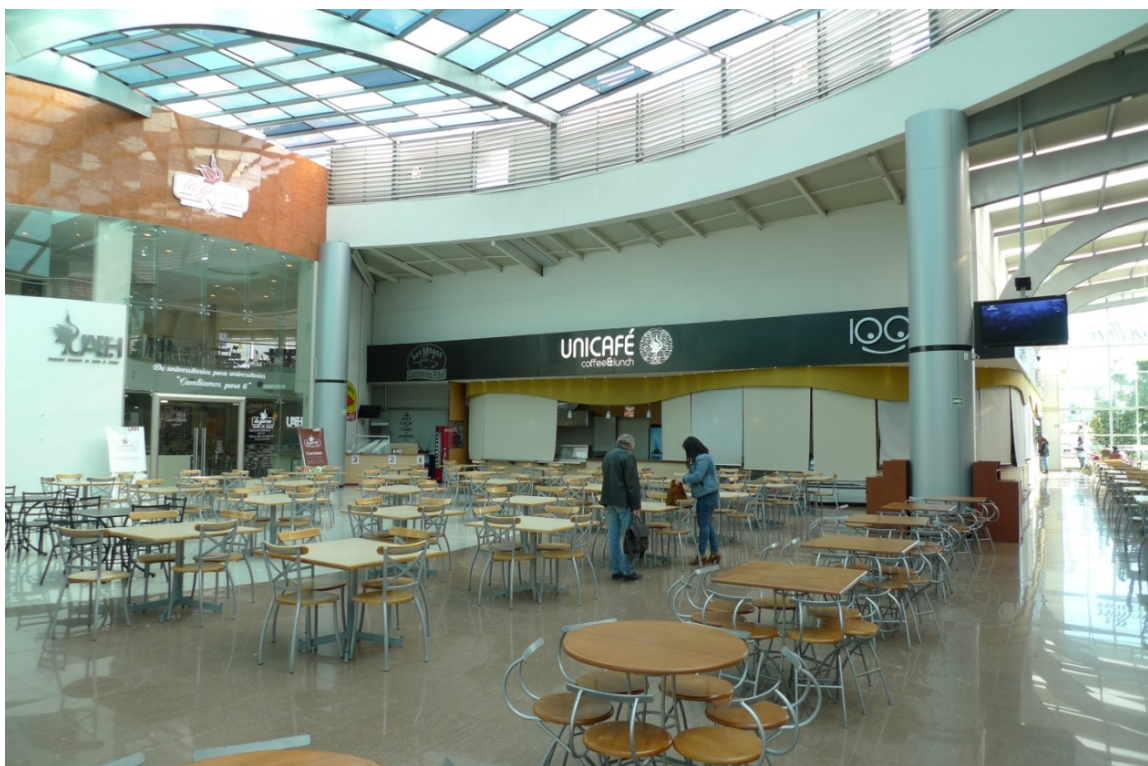
Фото 6 Студентка, яка з деяких причин не здала екзамен прийшла на перездачу в Pavellón