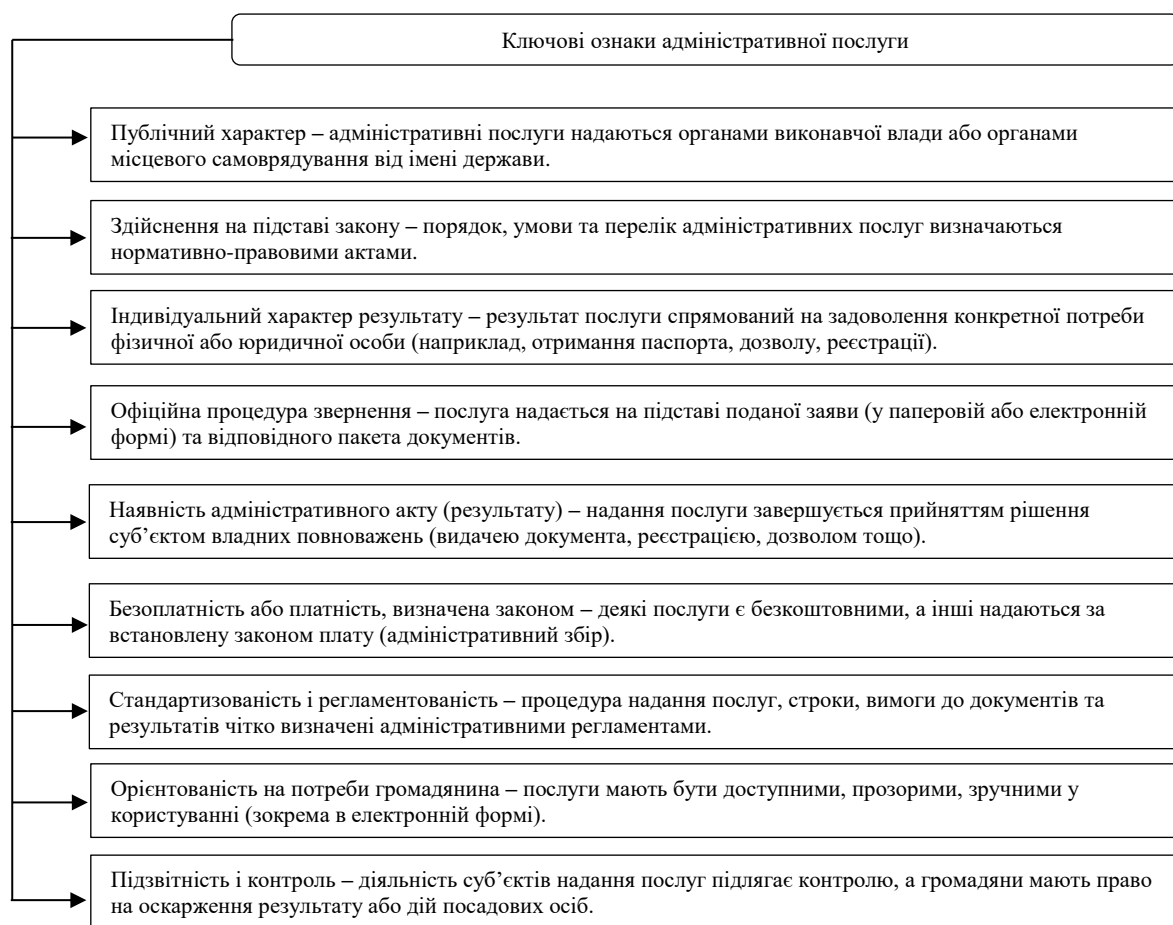
Рисунок 1. Ключові ознаки адміністративних послуг

Суб'єктами надання адміністративних послуг виступають органи державної влади (насамперед органи виконавчої влади) та органи місцевого самоврядування. До основних видів таких послуг належать видача дозвільних документів (ліцензій, дозволів, сертифікатів, свідоцтв, посвідчень), проведення різних видів реєстрацій (фактів, суб'єктів, прав, об'єктів), а також легалізація документів чи діяльності суб'єктів господарювання. З точки зору громадянина чи бізнесу отримання адміністративних послуг є складовою реалізації конкретних життєвих або господарських ситуацій, таких як народження дитини, придбання житла, започаткування підприємницької діяльності, виїзд за кордон тощо. Тобто процес надання адміністративної послуги безпосередньо інтегрований у повсякденну взаємодію особи з державою.